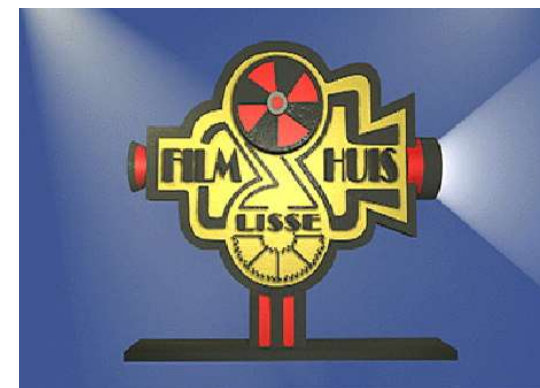
Filmhuis Lisse, opgericht in 1981

Bruno trouw blijft aan zijn berg. Ondanks hun totaal verschillende levens, blijft hun vriendschap onverwoestbaar.